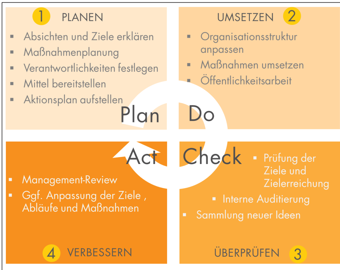
Abbildung 32: Regelkreis für das Energiemanagement

Zunächst wurden die Zuständigkeiten und Aufgabenbereiche der für die Umsetzung der Maßnahmen erforderlichen Akteure dargestellt. Grundlage ist der Plan-Do-Check-Act Zyklus der DIN EN ISO 50001 (Energiemanagementsysteme).