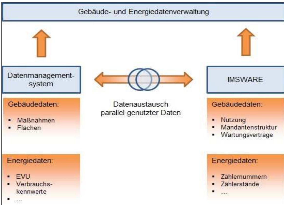
Abbildung 33: Datenfluss in der Energie- und Gebäudedatenverwaltung

Für die Umsetzung des Controllingkonzeptes sind folgende Maßnahmen vorgesehen