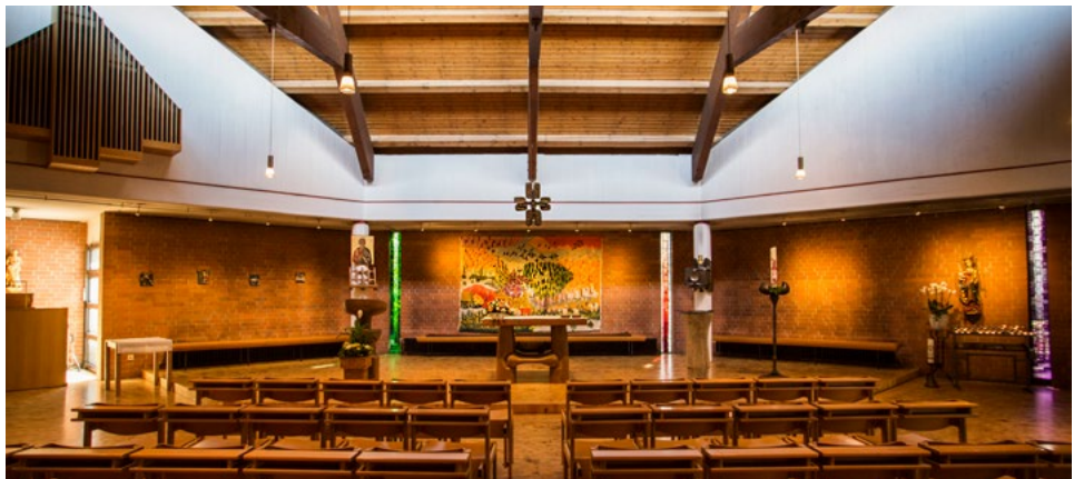
Blick in den katholischen Kirchraum des ökumenischen Zentrums

In diesem Kirchenzentrum sollte es einen gemeinsam genutzten Gottesdienstraum geben. Doch sowohl Präses Hans Thimme wie auch Erzbischof Lorenz Jaeger bestanden darauf, dass es im gemeinsamen Kirchenzentrum zwei getrennte Kirchenräume gibt. Ende 1970 stimmten schließlich beide Kirchenleitungen „dem (letztlich realisierten) Vorhaben zu, in dem neu zu errichtenden Kirchenzentrum eigenständige Gottesdiensträume in getrennter Trägerschaft vorzusehen – die evangelische Jakobus-Kirche und die katholische St. Andreas-Kirche unter dem einen Dach des neuen gemeinsamen Zentrums.“ 23