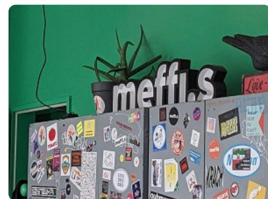
Langfristig soll das Altstadtquartier wieder aufblühen.

Der Verein meffis! e.V. ist ein Zusammenschluss diverser Initiativen, Vereine, Einzelpersonen, Stadtmacherinnen und Stadtmacher mit dem gemeinsamen Ziel, das Leben in Aachen bunter und lebenswerter zu machen. In vier aneinander angrenzenden leerstehenden Ladenlokalen in der Mefferdatisstraße 14 bis 18 baut der Verein auf ca. 400 Quadratmetern Fläche ein soziokulturelles Zentrum auf, an dem die sozial-ökologische Transformation der Stadt diskutiert, gestaltet und erlebt werden kann. Langfristig sollen die Leerstände im zentralen, aber benachteiligten Altstadtquartier am Büchel aufblühen zu einem Ort, der nicht nur gemeinsam genutzte Räume und Materialien, sondern auch allen Anwohnerinnen und Anwohnern einen Anlaufpunkt zum Austausch und zur Teilhabe an kulturellen und gesellschaftlichen Prozessen und