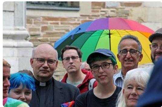
Bischof Dieser war bei der Enthüllung mit dabei.

»Aachen hat sich am Samstag als geschichtsbewusste und heutigen Erkenntnissen aufgeschlossene Stadt gezeigt. Die Enthüllung der Gedenktafel der 'Wege gegen das Vergessen', die an das Schicksal und die Verfolgung der Homosexuellen in der NS-Zeit erinnert, hat mich persönlich berührt. Sie zeigt die Vielschichtigkeit auf, mit der Menschen ab 1933 verfolgt und drangsaliert wurden. Auch heute ist es wichtig, Flagge zu zeigen für eine offene Gesellschaft, in der Menschen leben können, wie es ihrer Identität entspricht. Dies begründet und vermehrt nicht nur das persönliche Lebensglück der Einzelnen, sondern auch das Gemeinwohl.«