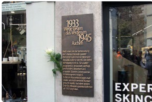
Eine neue Gedenktafel in der Innenstadt.