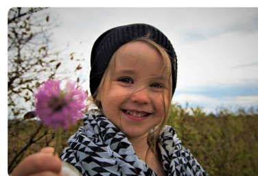
Mit Kindern wurden Blühbomben hergestellt.

Darüber hinaus beschäftigten sich Teilnehmerinnen und Teilnehmer in Dülken mit dem Mobilitätsthema in der Region und arbeiteten Ideen zur Stärkung eines nachhaltigen Individualverkehrs aus. Auch in Hehn gab es ein Projekt, in dem Grundschülerinnen und Grundschüler sogenannte Blühbomben herstellten.