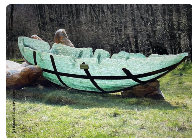
Das Kunstwerk die „Glasarche 3“ ist in den kommenden drei Monaten im Nationalpark Eifel zu sehen.

Der Nationalpark Eifel wird 20 Jahre. In diesem Zusammenhang hat die Nationalparkverwaltung das Glasarchen-Projekt ins Leben gerufen und wird das Kunstwerk die „Glasarche 3“ für drei Monate in die Eifel nach Vogelsang holen. Das Kunstobjekt steht als Symbol für die Zerbrechlichkeit der Natur und der Schöpfung. Vom 2. Juni bis zum 25. August 2024 findet immer sonntags ein 15-minütiger Impuls statt. Beginn ist jeweils um 11:30 Uhr, 12:30 Uhr, 13:30 Uhr und 14:30 Uhr.