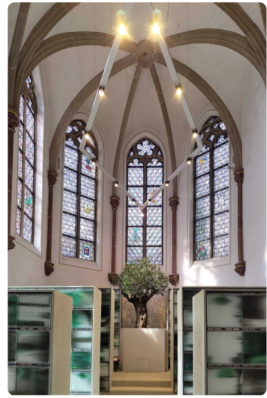
Die Norkapelle soll die Nordkurve im Borussia-Park abbilden.