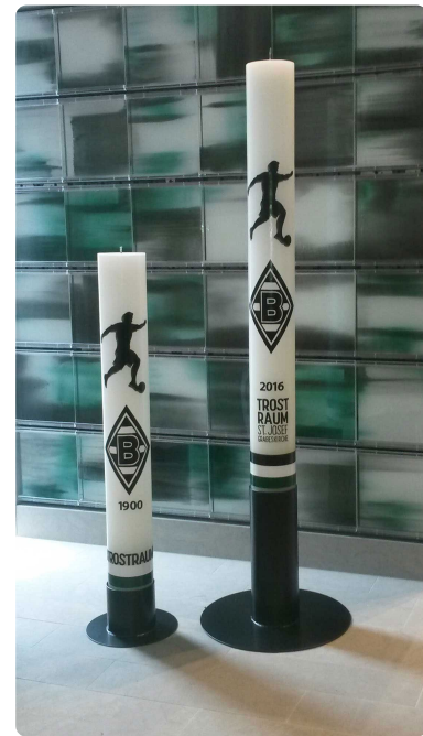
Im Trostraum steht auch die größte Borussenkerze, die zu Beisetzungen angezündet wird.

Die Idee dazu entstand, als die Verantwortlichen im Rahmen des Kirchlichen Immobilien-Managements (KIM) vor der Wahl standen, die Kirche zu schließen oder sie einem anderen Zweck zuzuführen. Da Lage und Größe von St. Josef vielversprechend waren, entschied man sich, einen Teil der Kirche für gottesdienstliche Zwecke zu erhalten und im anderen Teil einen Bestattungsort zu ermöglichen. Bei einem Vortrag des damaligen Borussia-Präsidenten Rolf Königs im Rahmen des Patroziniums in St. Marien entstand dann die Idee, in Kooperation mit den Fans einen besonderen Begräbnisort für Anhänger der Fohlen-Elf zu gestalten. Architekt Dr. Burkhard Schrammen setzte die Idee eindrucksvoll um. „Durch diesen