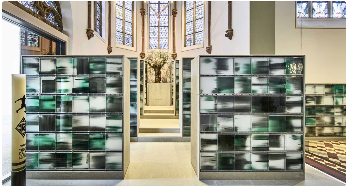
Der Olivenbaum stammt aus dem Gründungsjahr der Borussia.

Wer in Mönchengladbach den Trostraum St. Josef, genauer gesagt die Nordkapelle der Grabeskirche, betritt, wird von einem schwarz-grün-weißen Farbenspiel überrascht, das die Urnensteelen überzieht. Es erinnert an die Farben der Nordkurve des Stadions im Borussia-Park. Auch die Treppe, die Enge der Stelen, die Rauten-Lampe an der Decke und der im Fenster eingravierte Fußballer komplettieren die „Nordkurve“ der Grabeskirche. Hier können Fans der Borussen-Elf ihrem Verein bis über den Tod hinaus verbunden bleiben.