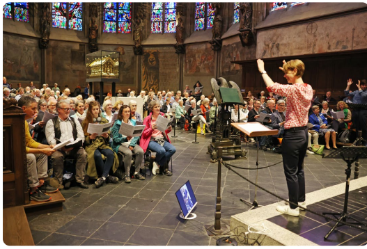
Am Ende des Tages erschallte im Hohen Dom zu Aachen ein imposanter Chor mit mehr als 850 Stimmen.