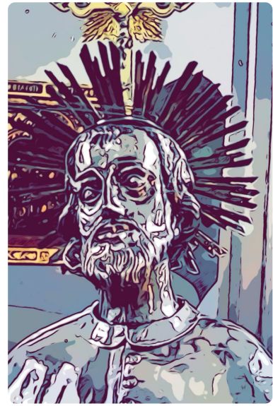
Das Grab des Hl. Arnold befindet sich in der Kapelle in Arnoldsweiler.

Zwischen dem 13. und 21. Juli 2024 steht die Festwoche unter dem Thema: „So viel du brauchst. Wie viel brauchst du?“ Sie möchte durch Impulse, Gottesdienste, Aktionen und Begegnungen zum Nachdenken anregen, was und wie viel zum eigenen Leben gebraucht wird. In der Nachfolge des hl. Arnold geht es beispielsweise darum, das Dorfleben sozialer zu gestalten oder klimaneutraler für die Schöpfung und nachhaltiger zum Wohl der nachfolgenden Generationen zu leben. Auch die Hilfe und die Sorge für Menschen in schwierigen Situationen soll in den Blick genommen werden. Die Kollekte der ganzen Woche ist für den Verein „IN VIA Katholischer Verband für Mädchen- und Frauensozialarbeit Düren-Jülich“ bestimmt.