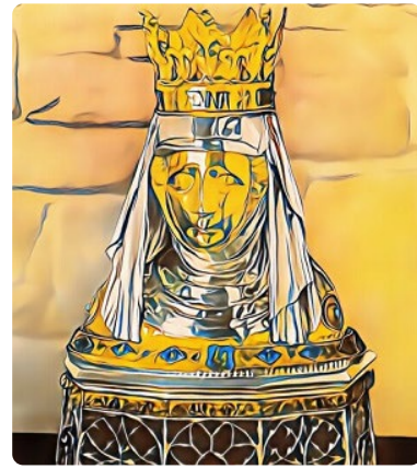
Die Pfarre St. Lukas lädt zur Verehrung des Annahauptes ein.

Die Pfarre St. Lukas lädt herzlich ein zur Verehrung des Annahauptes, zu den Gottesdiensten, zur Stille in der Annakirche, zum schönen Klang der Glocken, der Orgel und anderer Instrumente, zum Besteigen des Glockenturms und zur Begegnung mit anderen Menschen.