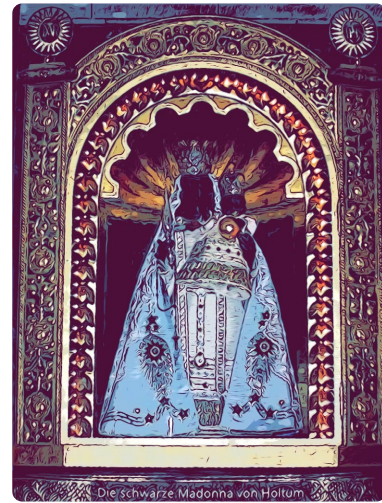
Bei der Holtumer Oktav wird die „Schwarze Madonna“ verehrt.

Immer um das Fest der Heimsuchung Mariens am 2. Juli herum (in diesem Jahr vom 30. Juni bis 7. Juli 2024 ), findet die Holtumer Oktav an der Marienkapelle statt. Ein Fest des Glaubens und der Gemeinschaft mit langer Tradition.