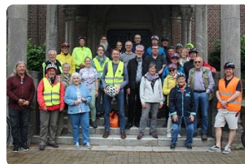
Rund 30 Radfahrende haben sich auf den Weg gemacht.

So wurde im Laufe der Planungsphase aus einer normalen Radtour eine Fahrt auf zwei Rädern durch ein Gebilde, das sich im wahrsten Sinne des Wortes noch zusammenfinden muss, bevor im Januar 2025 alle 44 Pastoralen Räume im Bistum Aachen gemeinsam an den Start gehen.