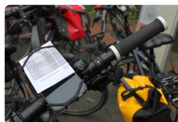
Auf dem Plan sind alle 14 Stationen vermerkt.