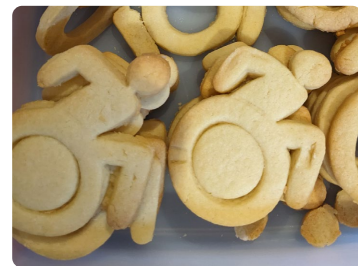
Im Angebot sind Kekse in Form von Rolli-Fahrern...