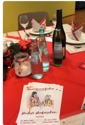
Die Termine für 2025 stehen schon fest.