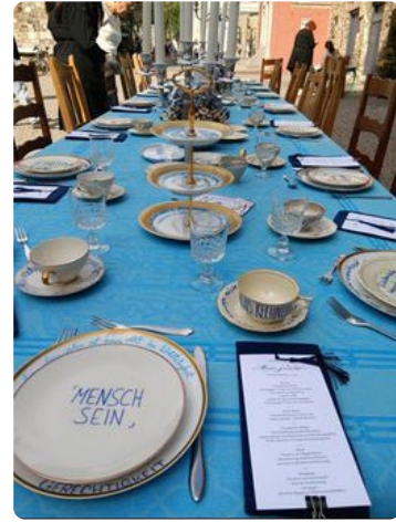
Ein Tisch, der zur Botschaft wird. Machen Sie mit!

Schon eine kleine Aktion kann Wirkung entfalten, wenn sie offen, wertschätzend und gut vorbereitet ist. Wichtig ist weniger Perfektion als die Haltung: zuhören, ernst nehmen, gemeinsam Raum schaffen und Begegnung ermöglichen.