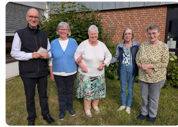
Der Vorstand der kfd St. Helena freute sich über den Besuch und die wertschätzenden Worte des Weihbischofs.