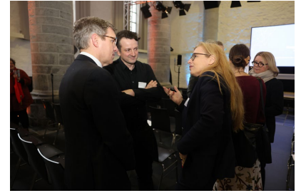
Angeregte Diskussionen gab es bereits vor dem Impuls des Referenten.